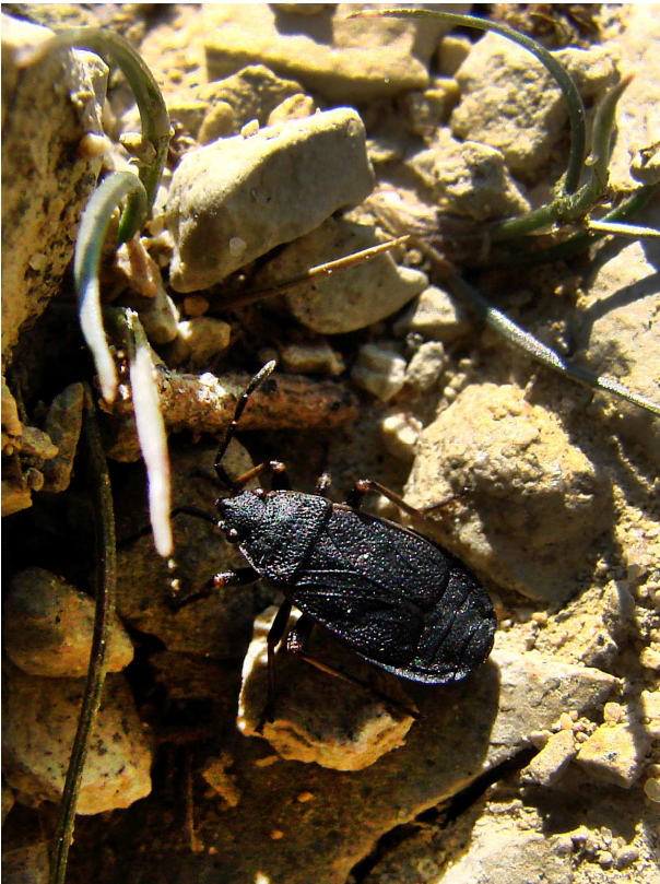
Ryc. 2. Pyrrhocoris marginatus w naturalnym środowisku [Fig. 2. Pyrrhocoris marginatus in its natural habitat].

Przedwojenne informacje o występowaniu omawianego gatunku w Polsce ograniczają się do niesprecyzowanych danych entomologów niemieckich, zawartych w kluczach do oznaczania (Lis 2001, 2007). W 2000 roku został odłowiony na Dolnym Śląsku (Opole, Wyspa Bolko, UTM: YS01) (Lis 2001), z niewiadomych przyczyn stwierdzenie to nie zostało ujęte w Suplemencie do Katalogu Palearktycznych Heteroptera (Aukema i in. 2013). Niedawno jego występowanie na Dolnym Śląsku (Suchy Bór, UTM: BB91) zostało potwierdzone (Lis 2017).