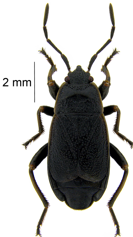
Ryc. 1. Pyrrhocoris marginatus (fot. A. Taszakowski) [Fig. 1. Pyrrhocoris marginatus (phot. A. Taszakowski)].

Preferuje ciepłe i suche, otwarte siedliska (Wachmann i in. 2007), chociaż spotykany jest także w nieco bardziej wilgotnych, np. parkach i ogrodach (Lis 2007, 2017). Często jest znajduwany pod kamieniami (Voigt 2004). Prawdopodobnie odżywia się leżącymi na powierzchni gleby nasionami, jednak powiązania troficzne z określonymi roślinami nie są dobrze poznane. Osobniki tego gatunku często są spotykane w sąsiedztwie robinii akacjowych ( Robinia pseudoacacia ), która to roślina jest jednak wtórnym pokarmem P. marginatus , ponieważ w Europie została introdukowana, a pochodzi z Ameryki północnej (Voigt 2004). Wachmann i in. (2007) podają także jako roślinę żywicielską zmiowiec ( Echium ).