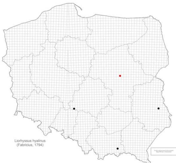
Ryc. 1. Stanowiska Liorhyssus hyalinus w Polsce; czarne kółka – stanowiska literaturowe, czerwone kółko – nowe stanowisko [Fig. 1. Localities of Liorhyssus hyalinus in Poland; black circles – literature data, red circle – new record].

Liorhyssus hyalinus (Fabricius, 1794) był dotychczas podawany z naszego kraju tylko z trzech stanowisk (ryc. 1). Najstarsze dane dotyczące tego gatunku (Grybów w Beskidzie Zachodnim) pochodzą z początku XX wieku (Smreczyński 1907). Kolejne stanowisko tego gatunku (projektowany rezerwat „Zawadówka” na Wyżynie Lubelskiej) zostało stwierdzone pod koniec XX wieku (Smardzewska-Gruszczak i Lechowski 2000; Lechowski i Smardzewska-Gruszczak 2006).