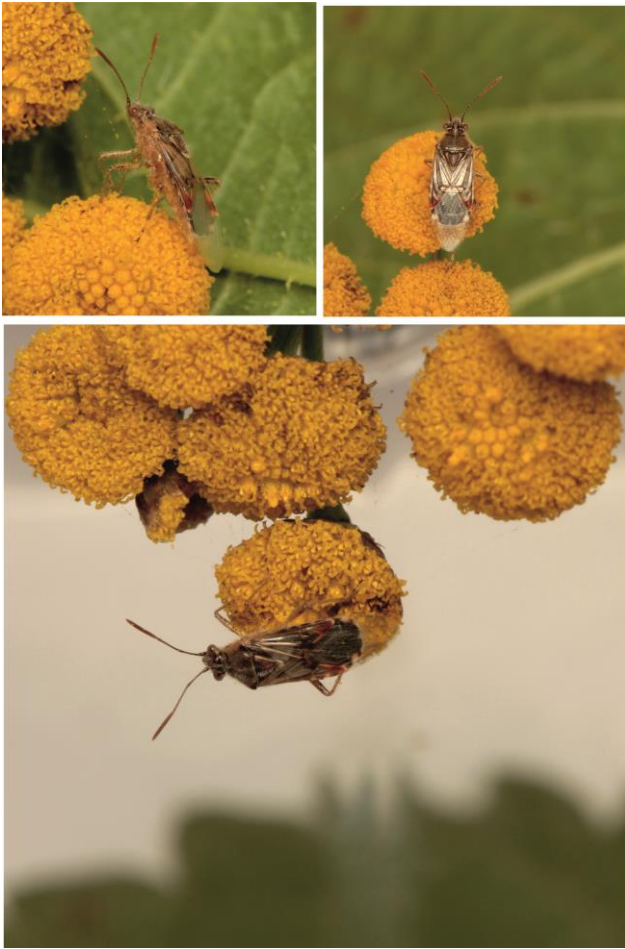
Ryc. 3. Liorhyssus hyalinus na stanowisku w dzielnicy Białołęka w Warszawie [ Fig. 3. Liorhyssus hyalinus on location in Białołęka district in Warsaw].

Na stanowisku tym (UTM: EC09), w dniu 17 października 2017 roku, stwierdzono występowanie okazów tego gatunku (ryc. 3), w tym kopulującą parę.