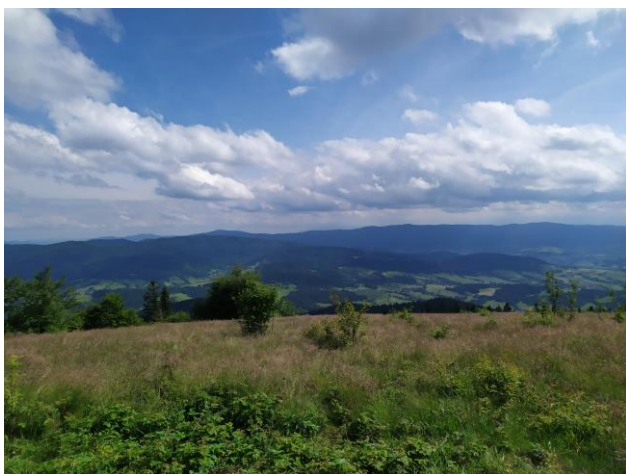
Ryc. 3. Stanowisko Odontoplatys bidentulus w masywie góry Ćwilin. [ Fig. 3. Site of Odontoplatys bidentulus in Ćwilin Massif].